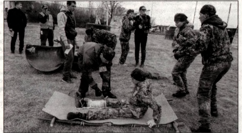
Спортивно-интеллектуальная игра «По дорогам предков». Этап «Оказание первой медицинской помощи и переноска пострадавшего»

Оборудованный спортзал позволил на базе шумненской школы проводить районные зальные соревнования по туристической технике, которые состоялись в де-